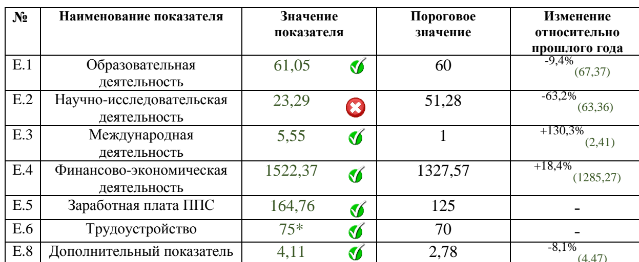
Таблица 1 – Результаты мониторинга РГЭУ (РИНХ)

Отметим, что Ростовский Государственный Экономический университет (РИНХ) превысил пороговые значения шести показателей эффективности из семи оцениваемых, т. к. показатель Е.7 (контингент студентов) рассчитывается только для филиалов). К примеру, средний балл ЕГЭ студентов РГЭУ (РИНХ) составил в 2015 году 61,05 среди принятых студентов по всем формам обучения. Это говорит о том, что в вуз стремятся поступить абитуриенты с относительно высокими показателями по учебе.