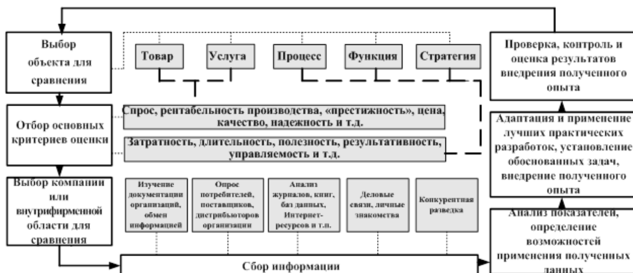
Рисунок 3 – Алгоритм применения бенчмаркинга для формирования конкурентоспособной стратегии развития вуза

Осуществление общего управления образовательной организацией определяет процесс внедрения бенчмаркинга вне зависимости от его вида с целью повышения эффективности деятельности и обеспечения конкурентоспособности высшего учебного заведения (рисунок 3).